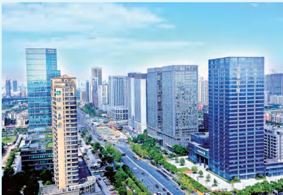
图中心施工区域即为博奥路站。(现已开通)