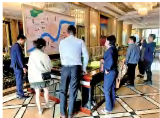
地铁上盖 坐拥百万人潮

项目西侧紧邻河庄街道办，配套齐全，居住氛围成熟，多个小区环绕。从北向南依次有江东锦苑、蜀南小区、金色和庄、金逸雅苑、德信大江原著、钱塘一品、天际湾等数十个社区。万人稳定客流，数亿元的消费市场，财富浪潮势不可挡。