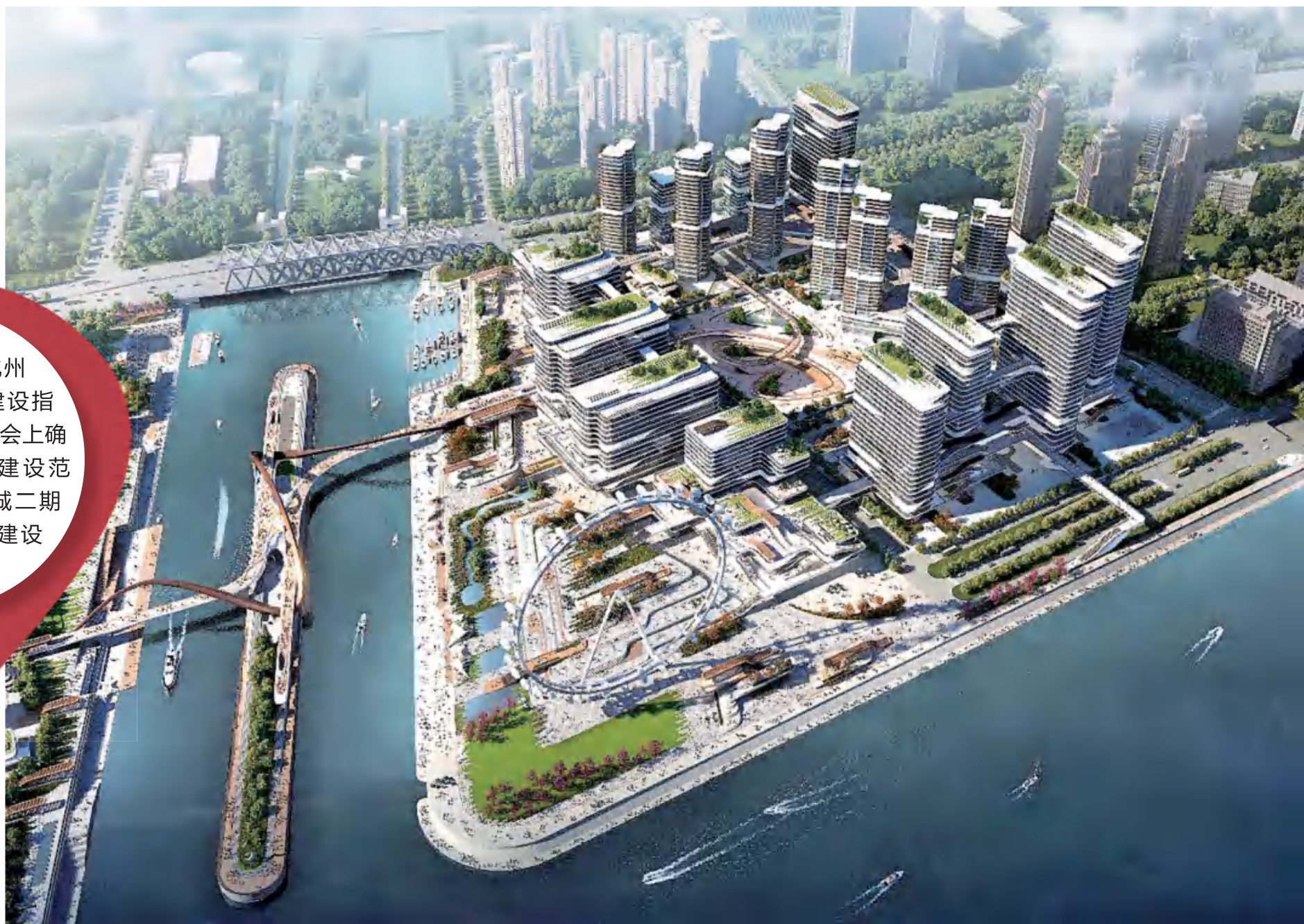
江河汇城市综合体效果图，未来“杭州眼”摩天轮令人期待。

4月22日，杭州市钱江新城二期建设指挥部召开首次会议。会上确定了钱江新城二期建设范围，明确了钱江新城二期亚运会前及未来建设计划。